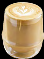
カフェラテ Cafe latte