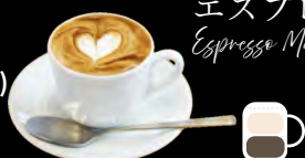
エスプレッソ・マキアート Espresso Macchiato