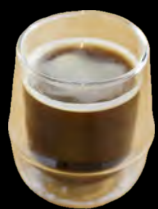
ロングブラック Long black