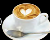
エスプレッソ・マキアート Espresso Macchiato